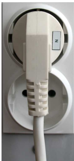
Рис.2. Подключение к сети.

Внимание! При включении приборов с большими пусковыми токами при работе от АКБ, на короткое время может сработать защита от перегрузки. Это сопровождается звуковым сигналом, показаниями индикатора нагрузки и не является неисправностью.