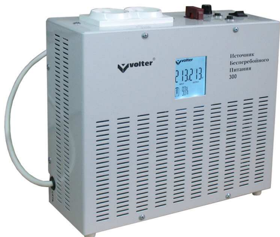
Рис.1. Общий вид ИБП-300.

Источник бесперебойного питания ИБП-300 ТМ Volter выполнен в прямоугольном металлическом корпусе, который позволяет эксплуатировать его как в настенном, так и настольном (или напольном) варианте (Рис.1). На верхней панели расположены розетки для подключения нагрузки, кнопки управления режимами работы, клавиша включения и выключения, держатель предохранителя «Сеть», держатель предохранителя «АКБ». На лицевой части прибора расположен жидкокристаллический индикатор режимов работы. С левой стороны корпуса выходит шнур подключения к сети 220В. С правой стороны два шнура с наконечниками для подключения АКБ.